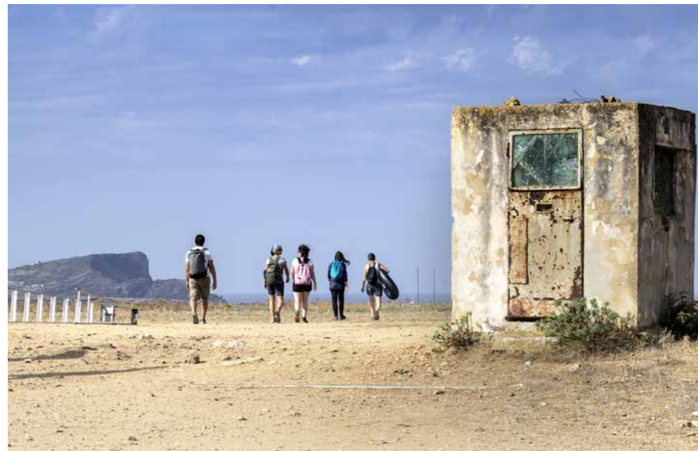
Nelle foto, performance e installazioni con il riutilizzo di materiali rinvenuti in loco

Il progetto, organizzato dall'Associazione LWCircus-Onlus , vede il coinvolgimento di istituzioni accademiche internazionali e la collaborazione del Parco Nazionale dell'Asinara, della Direzione FO.RE.S.T.A.S. di Sassari e della Conservatoria delle Coste della Sardegna. L'iniziativa fa parte della serie di workshop